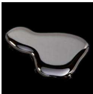
Il mercurio è una sostanza che assunta in quantitativi troppo elevati, può avere effetti negativi anche gravi

Detto questo, procediamo entrando nel merito della questione. Secondo le normative nazionale ed europea, il quantitativo limite di mercurio contenuto in acque a uso umano è di 1 microgrammo per litro. Il mercurio infatti è una sostanza che non ha alcuna funzione specifica nel corpo umano e, assunta in quantitativi troppo elevati, può avere effetti negativi anche gravi.